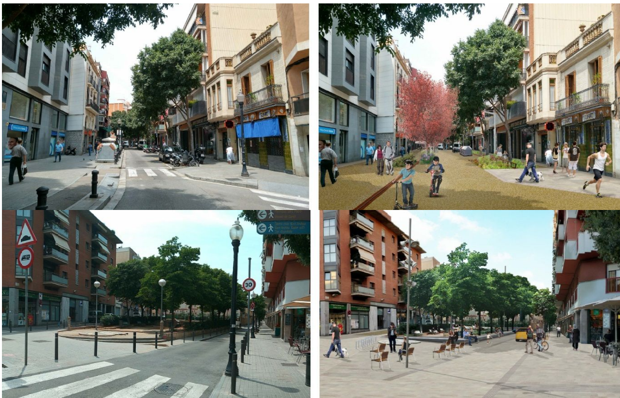
Imatges actuals del carrer amb recreacions virtuals del mateix punt del carrer ja reurbanitzat

superfície de tots els carrers transversals integrant el disseny de la proposta dins l'entorn urbanitzat. A més, es renovarà l'àrea infantil de la plaça de la Pomera.