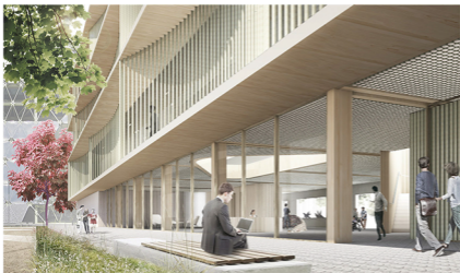
Vestíbul públic i obert cap a la ciutat