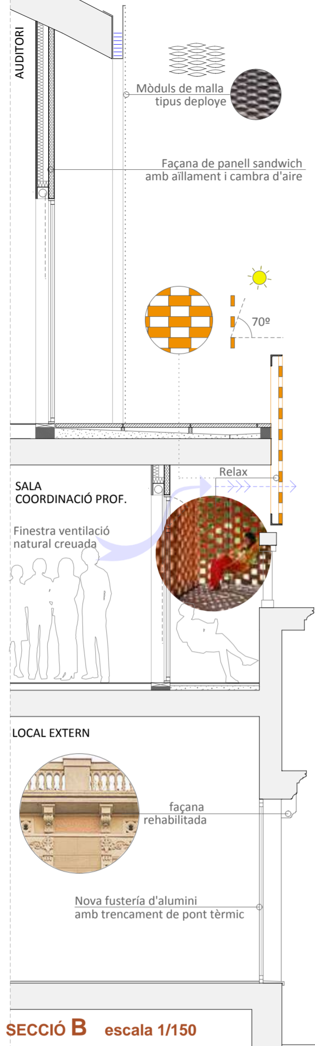
SECCIÓ B escala 1/150