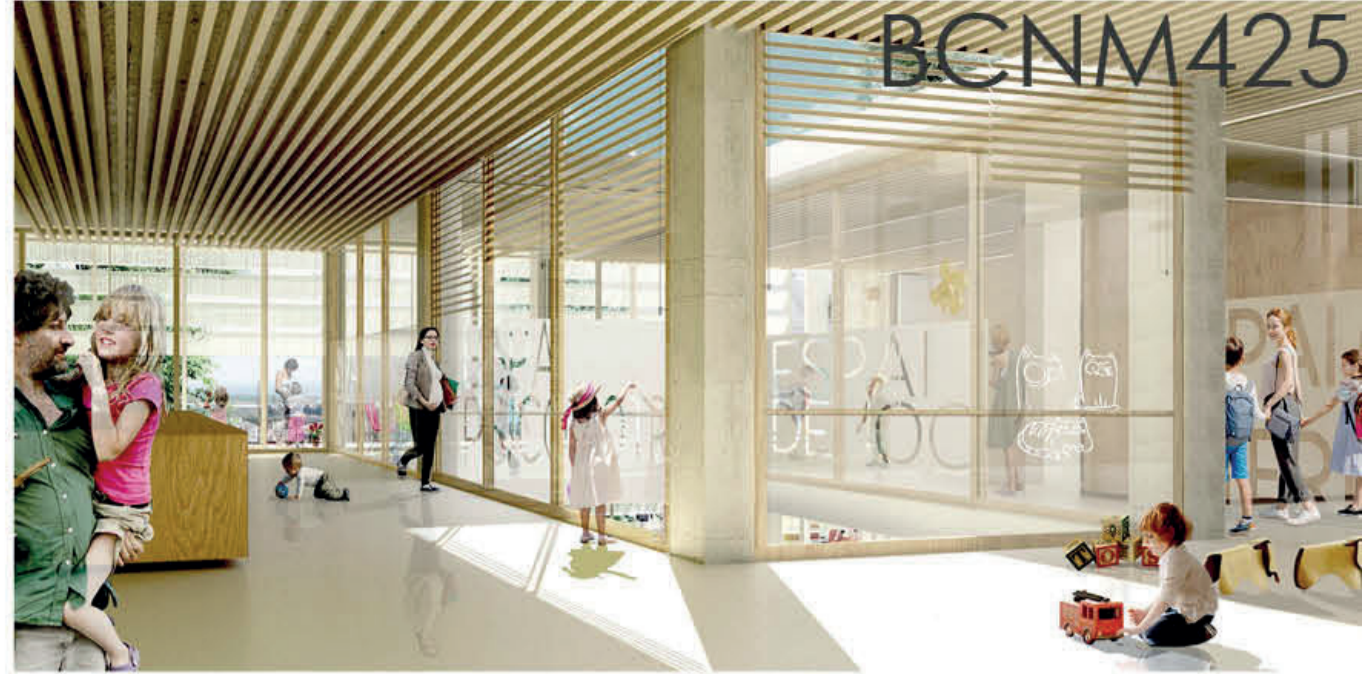
P5. CASAL INFANTIL. ÀREA D'ACOLLIDA I PATI.