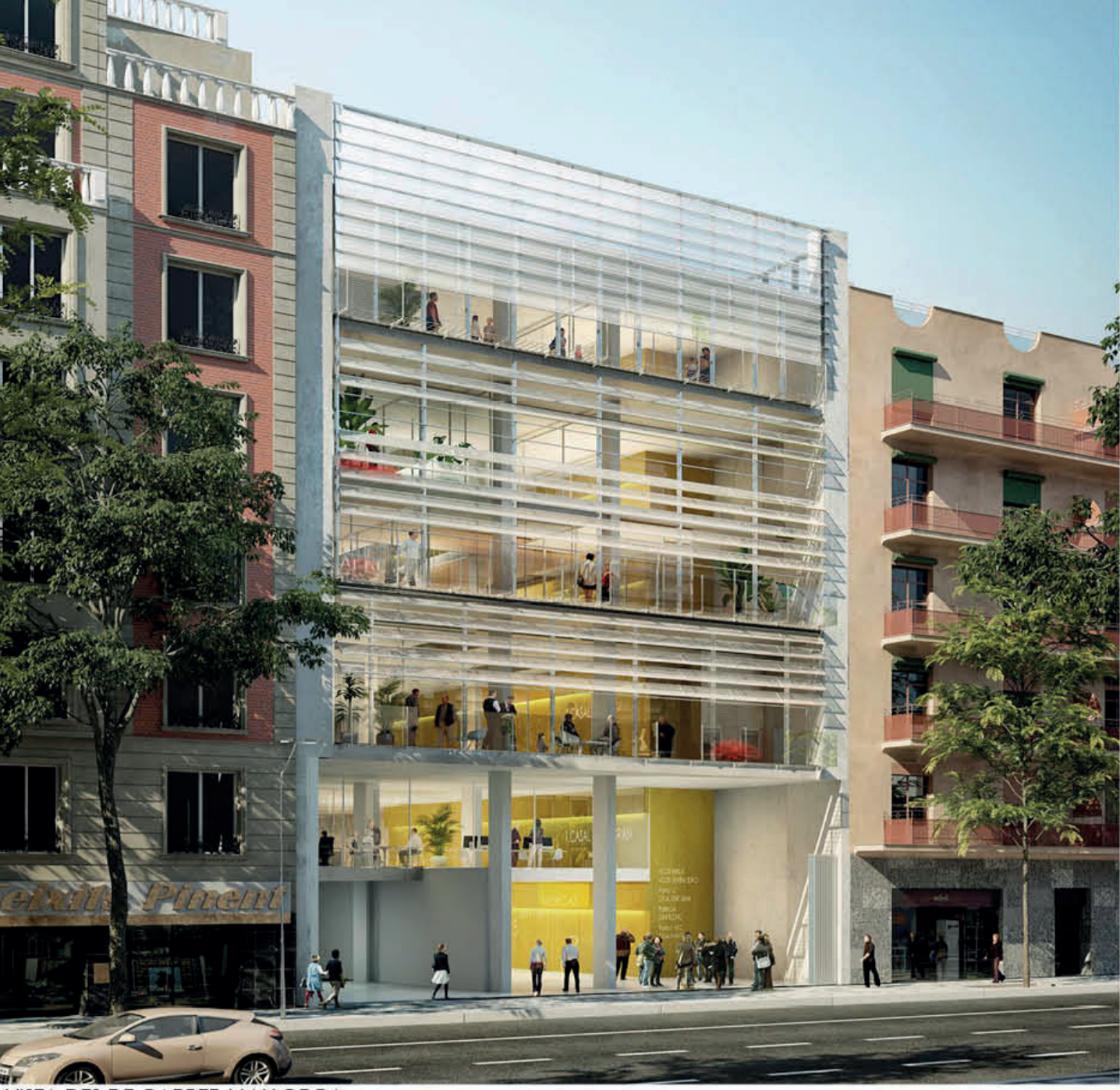
VISTA DES DE CARRER MALLORCA