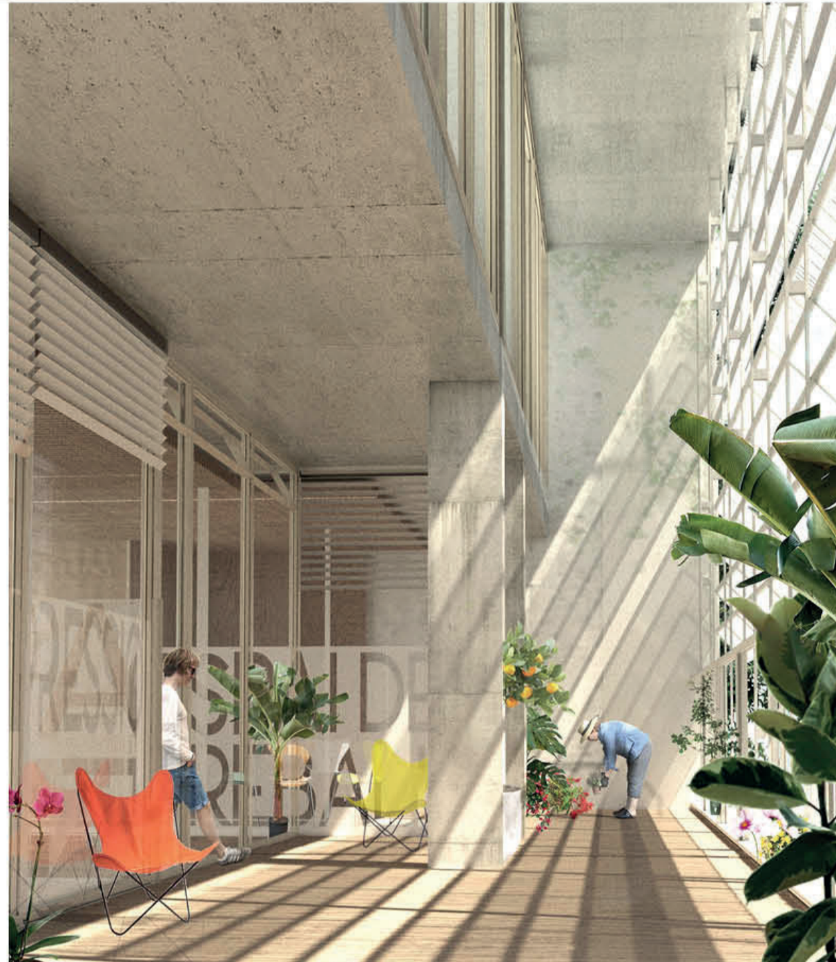
P3. CENTRE CÍVIC. VISTA DE TERRASSA-ÀREA DE TROBADES.