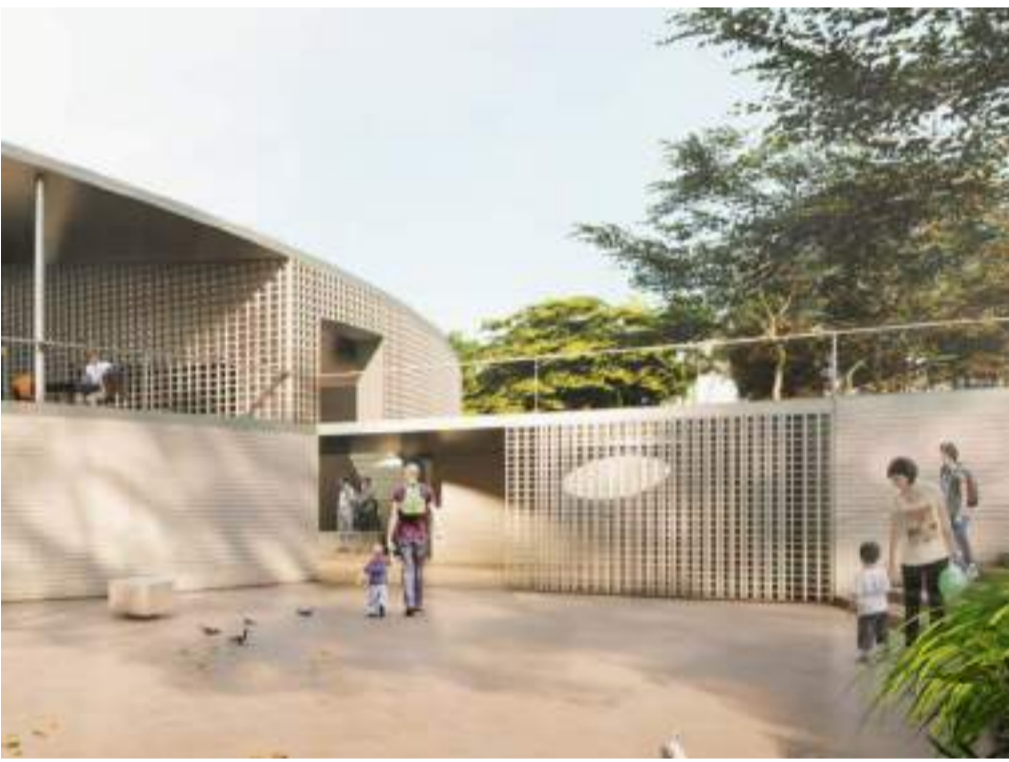
VISTA 1 _ PLAÇA D'ACCÉS A nivell icònic proposem mantenir la punxa volada de la coberta BRU reclam de l'espai d'entrada. S'accedeix sota porxo a la planta baixa, amb la recepció-escala i ascensor.