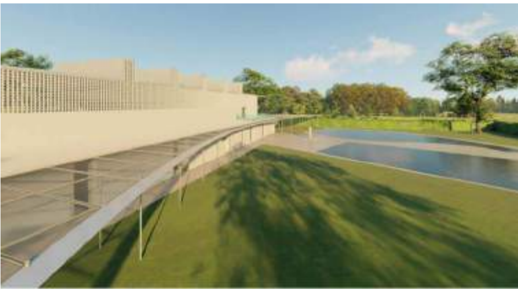
VISTA 2 _ LES PISCINES Manteniment de la piscina existent rebaixada i creació d'una piscina lúdica de molt poca fondària, augmentant la superfície de làmina d'aigua per poder augmentar en paral·lel l'aforament.