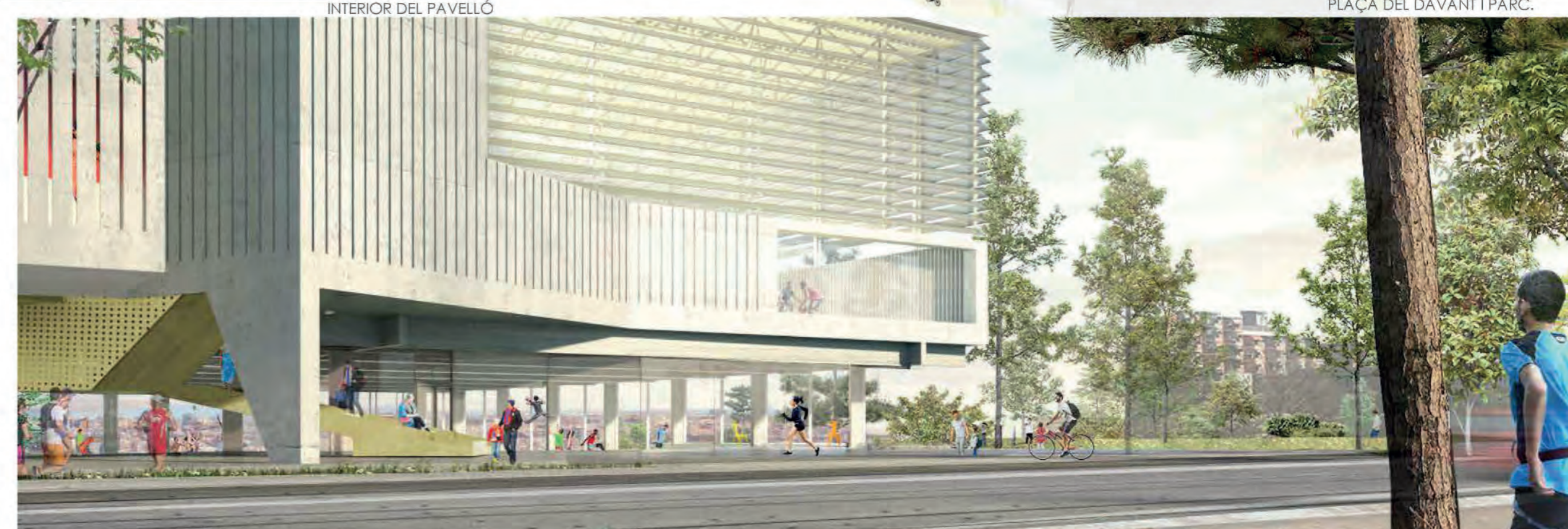
PROPOSTA I RELACIÓ ENTRE CEM, PLAÇA DEL DAVANT I PARC.