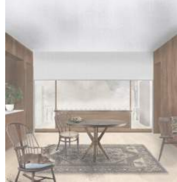
CANCEL·LS, LÍMITS ENTRE L'EXTERIOR I L'INTERIOR

La tercera de les intervencions són la incorporació d'una sèrie de cancel·ls que ajuden a relacionar els edificis amb els espais exteriors i, a més a més, ajuden els condicionants d'accessibilitat.