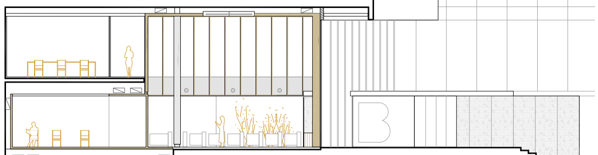
SECCIÓ 3 1:200