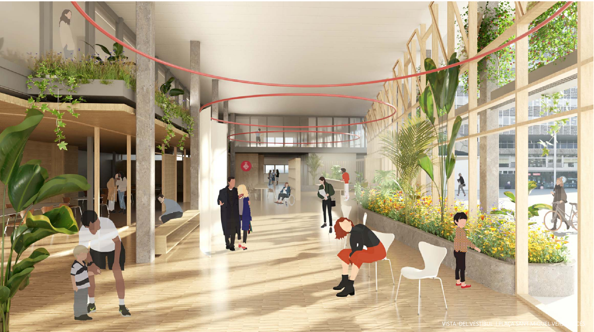
VISTA DEL VESTIBUL I PLAÇA SANT MIQUEL VERSUS ACCÉS