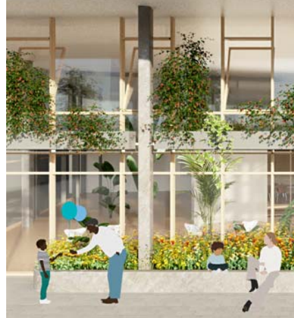
INTERVENCIÓ EN FAÇANA