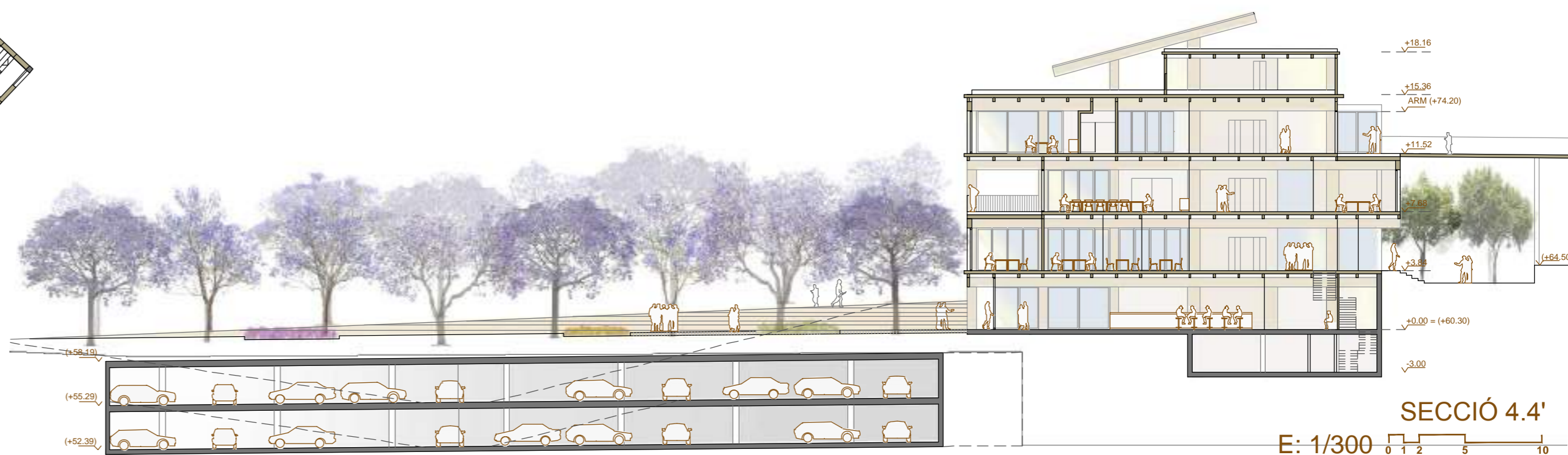
SECCIÓ 4.4' E: 1/300