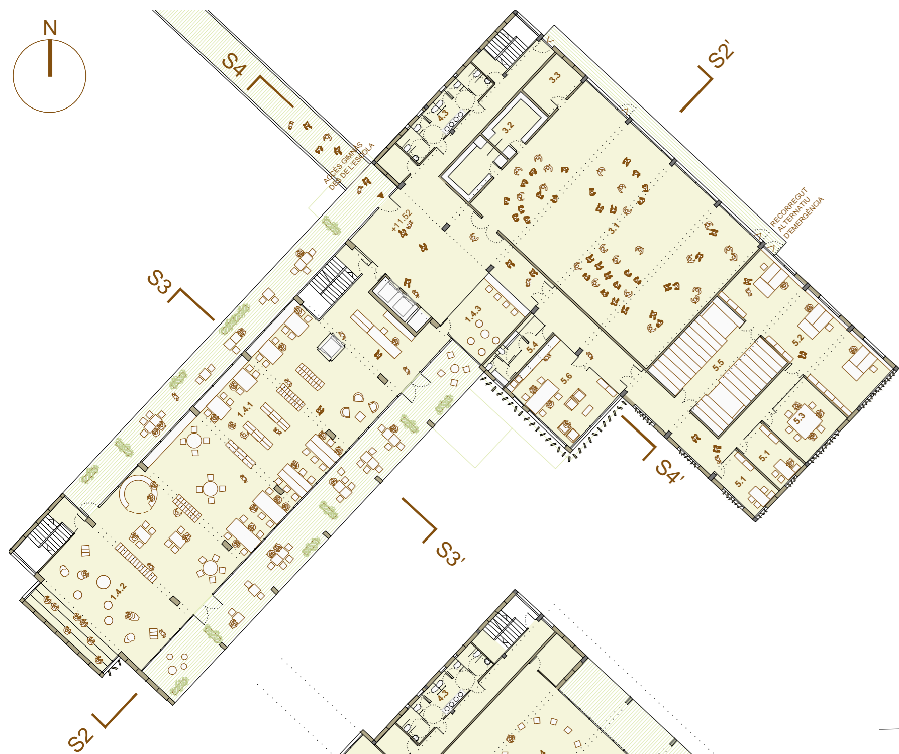
PLANTA 3 (COTA 71,82) E:1/300