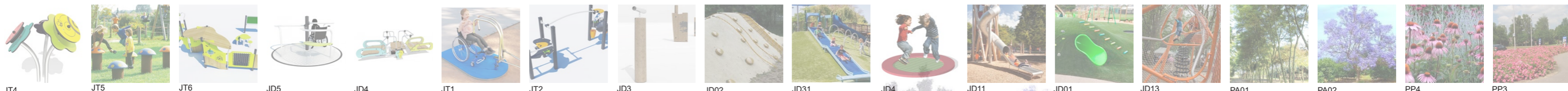
0 a 5, 6 a 12 i +12 anys 6 a 12 i +12 anys +12 anys Vegetació