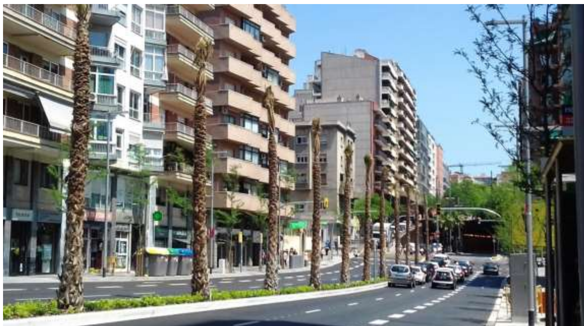
Imatge de després de la remodelació