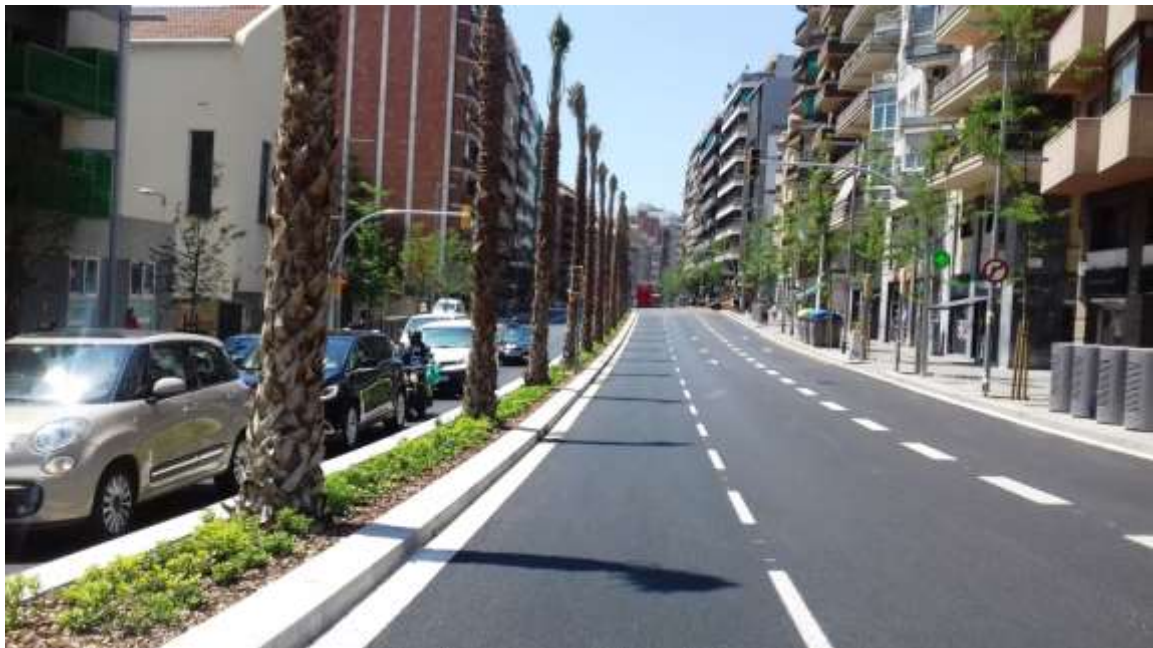
Imatge de després de la remodelació

A més, s'ha eliminat l'efecte barrera que ha suposat la ronda del Mig en la seva configuració inicial, que pràcticament impossibilitava la relació entre barris situats a banda i banda de la Travessera i s'han suprimit barreres arquitectòniques.