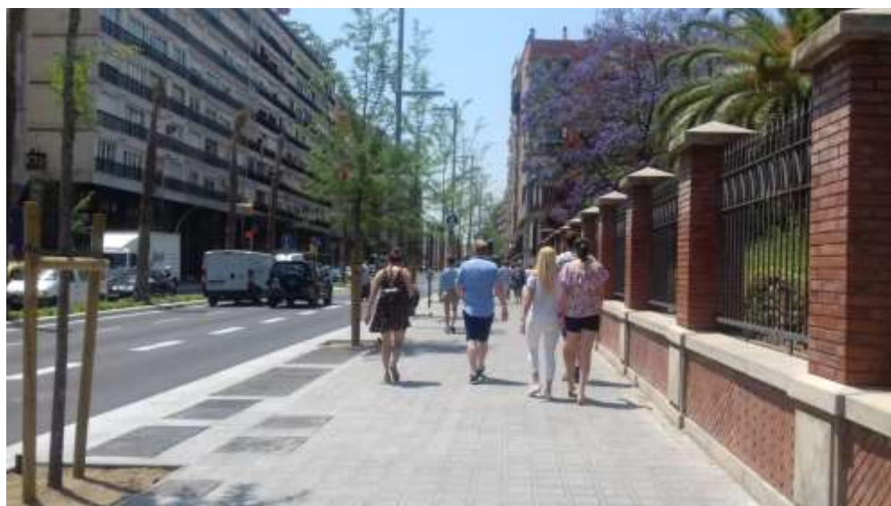
Imatge de després de la remodelació