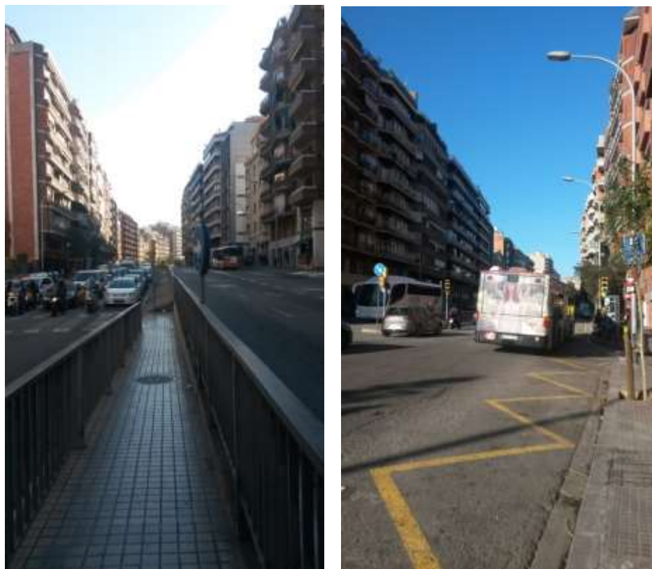
Imatges d'abans de la remodelació