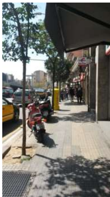
Imatges d'abans de la remodelació