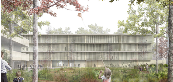
Vista façana interior d'alta