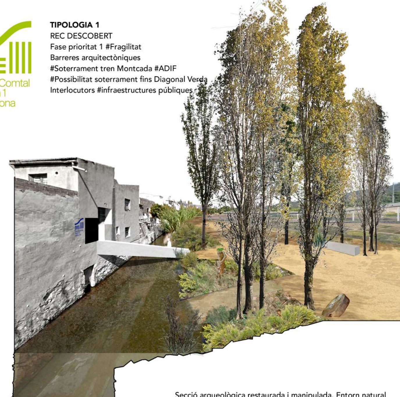
Secció arqueològica restaurada i manipulada. Entorn natural