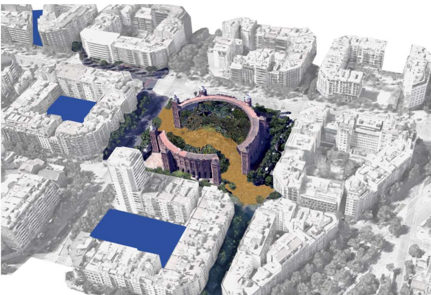
La Monumental com una illa de l'Eixample

TIPOLOGIA 1 REC DESCOBERT Fase prioritat 1 #Fragilitat Barreres arquitectòniques #Soterrament tren Montcada #ADIF #Possibilitat soterrament fins Diagonal Verda Interlocutors #infraestructures públiques Rec Comtal Tram 1 Vallbona