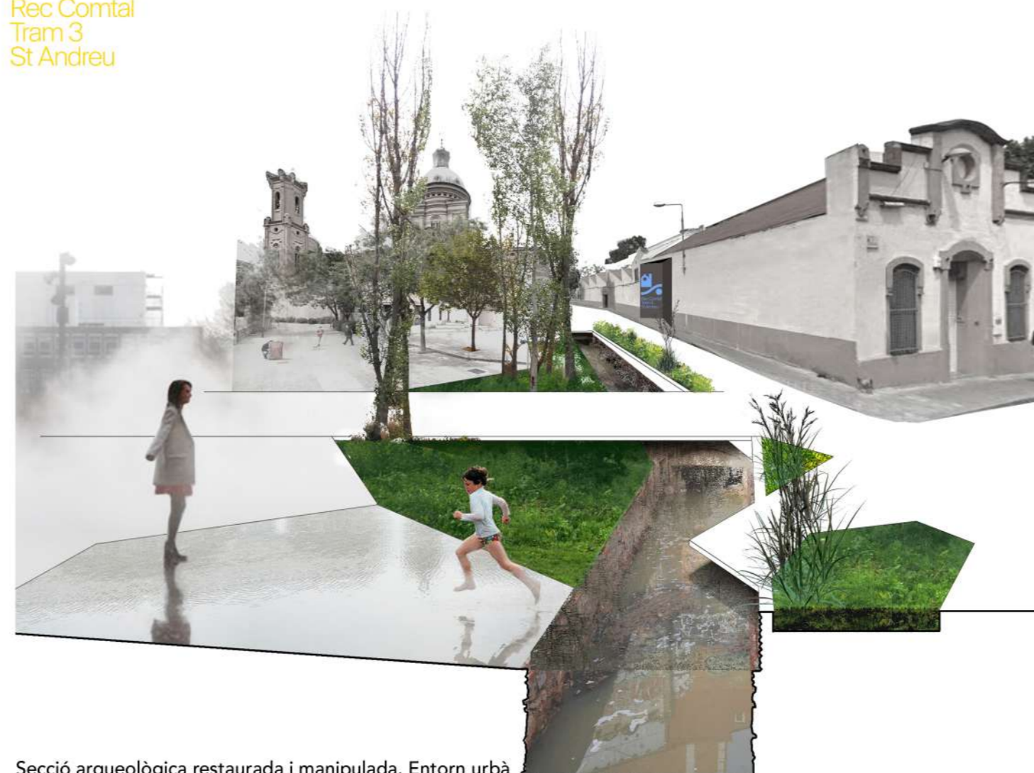
Secció arqueològica restaurada i manipulada. Entorn urbà